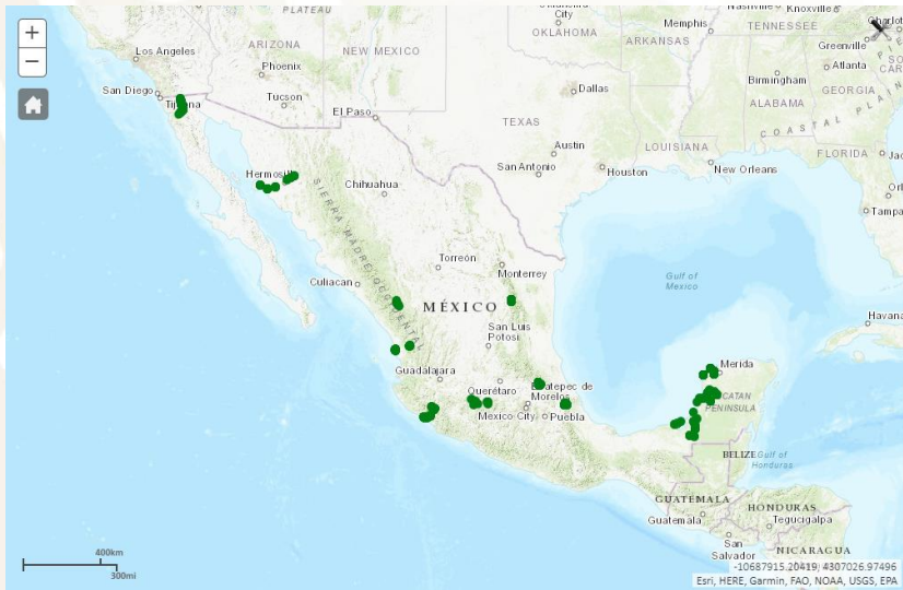
Observaciones registradas del 01 de enero al 26 de septiembre de 2024