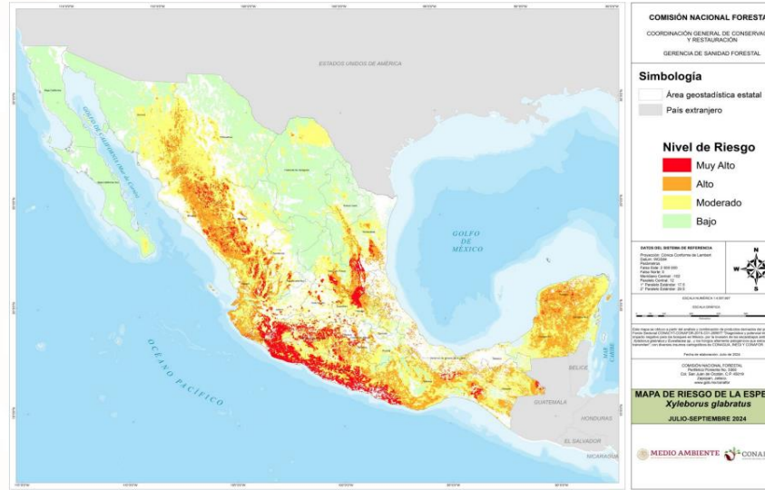
Mapa de riesgo del periodo julio-septiembre 2024.